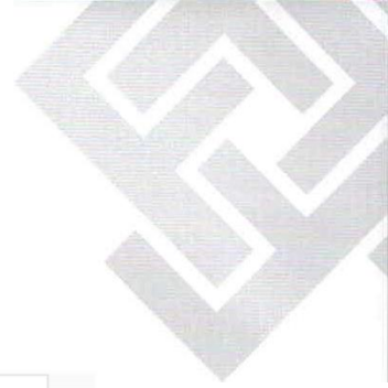
TABELA III - ATOS ESTATÍSTICOS